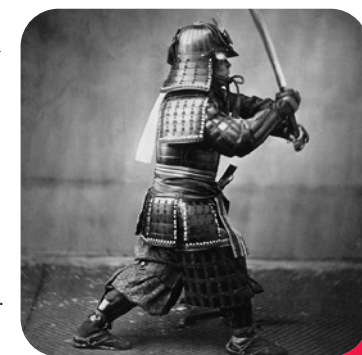
Combat comme un Samouraï (13-15 ans)