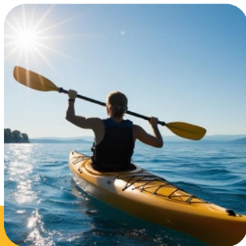
Rando en kayak sur le lac