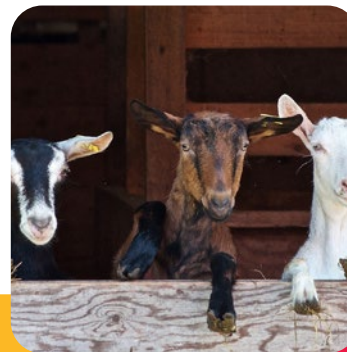
Visite d'une ferme (animaux, fruits et légumes)