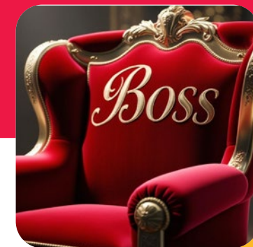
Deviens le Boss de ta vie