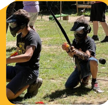
Archerie Fun Combat